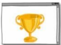
Voir le défi de Vinz et Lou

Une fois l'animation terminé cliquer sur l'icône « voir le défi » puis répondre aux questions.