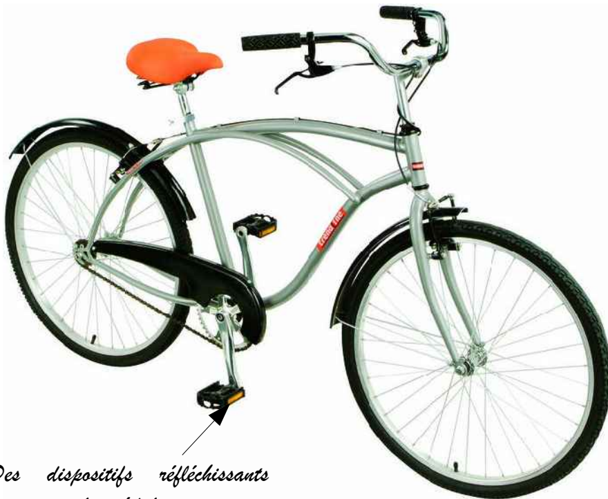
Des dispositifs réfléchissants orange sur les pédales

François a reçu un nouveau vélo pour son anniversaire. Il envisage de venir avec son vélo au Collège. Note sur la photo quels équipements obligatoire il doit installer afin de rouler en toute sécurité, en toutes saisons et de jour comme de nuit. Dessine cette élément sur la photo (au crayon à papier).